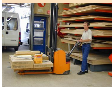
Mécanisation des manutentions