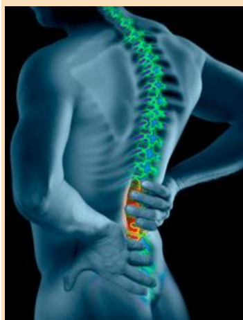
Lésion dorso lombaire

La norme NF-X 35-109 sur les limites acceptables de port manuel de charges recommande 25 kg pour les hommes et 12,5 kg pour les femmes.